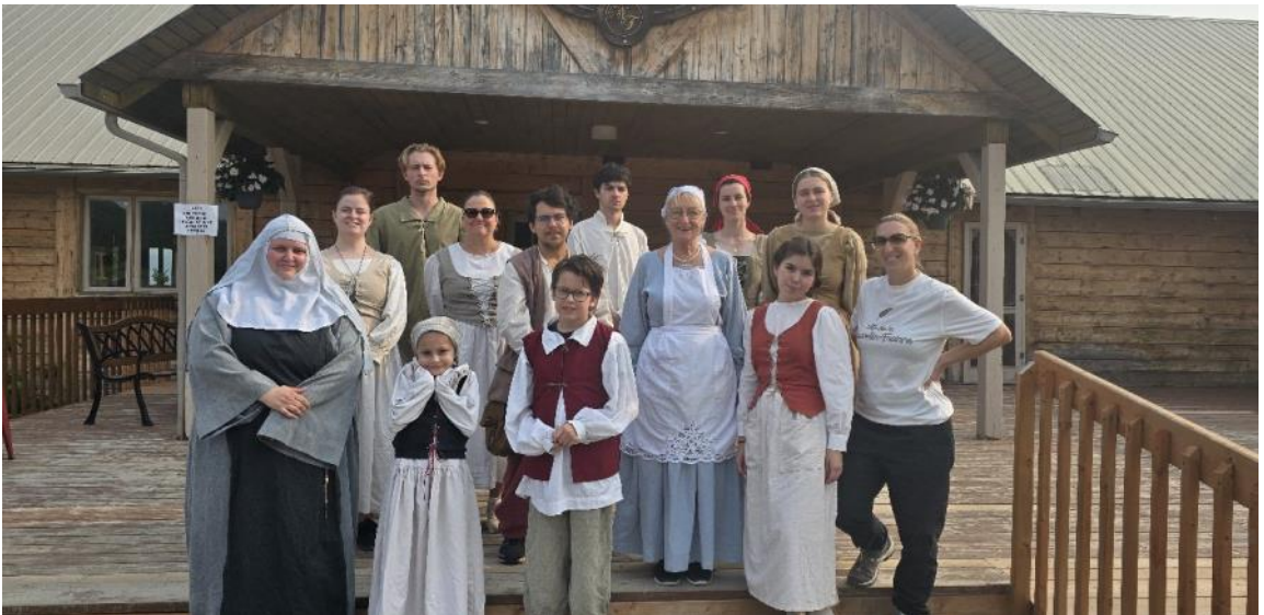
L'équipe du Site de la Nouvelle-France vous dit à l'an prochain!

Pour cela, nous vous disons merci et à l'an prochain où nous vous offrirons plusieurs nouveautés.