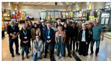
La cuvée des artistes 2025 (manquante sur la photo, Mme Thérèse Fortin)