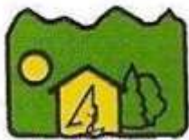
Association des propriétaires riverains du Lac Otis (APRLO)

Nous avons le plaisir d'annoncer que nos activités prévues pour l'été commenceront sous peu. Cette saison, une série d'événements seront organisés pour renforcer les liens entre les membres et profiter pleinement de la richesse naturelle du précieux lac Otis. Nous espérons que vous serez présents en grand nombre pour partager ensemble des moments chaleureux.